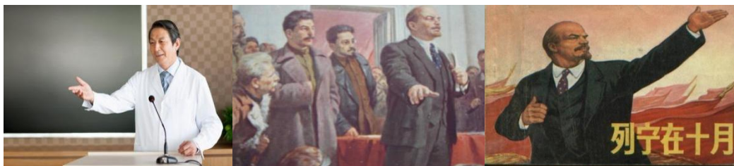
手掌如何运用的示意图