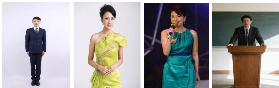
站立时双手姿势演示图